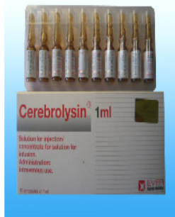
Cerebrolysin® Церебролизин® Тарьж хэрэглэхэд зориулсан уусмал